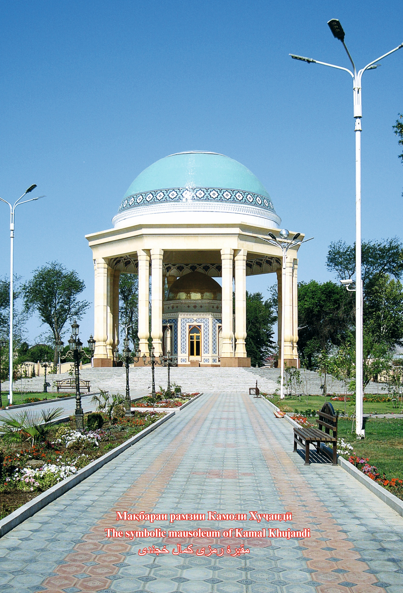
Мақбараи рамзи Камоли Хуҷандӣ The symbolic mausoleum of Kamal Khujandi مقبره رمزی کمال خجندی